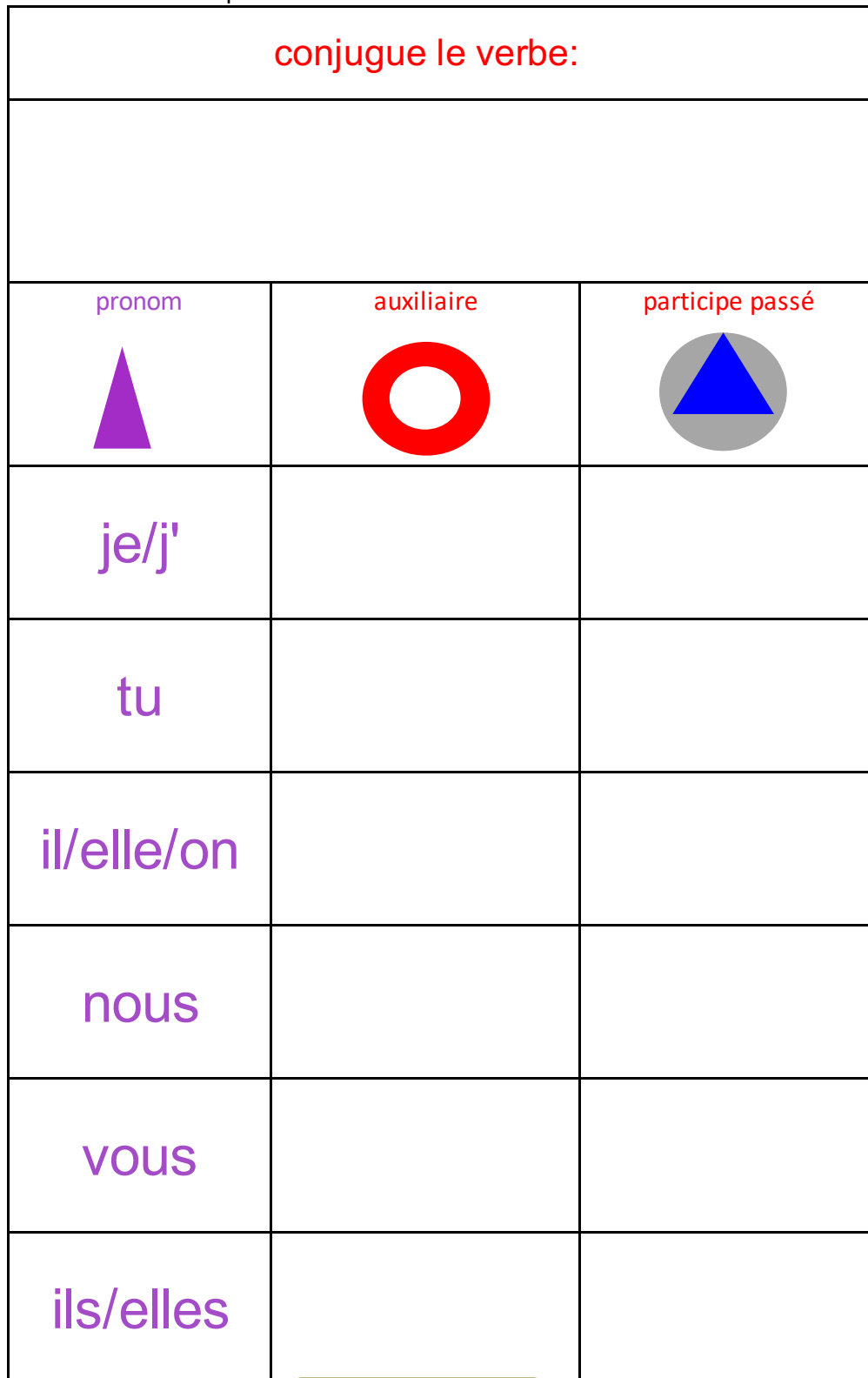
tableau en 5 exemplaires