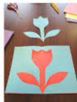
(6) et (7)