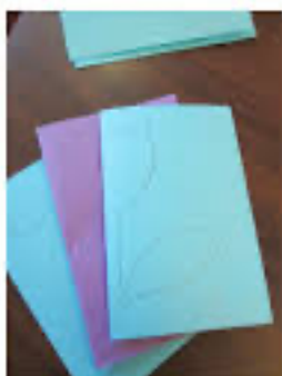
(1) à (4)